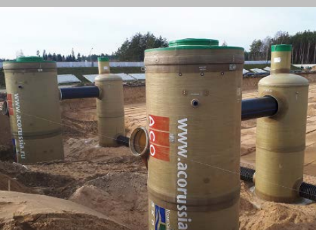
Индустриальный парк "Великий камень" "Оборудование для очистки поверхностного стока в составе ЛОС накопительного типа с самым большим в мире безбетонным аккумулирующим резервуаром АСО StormBrixx, Минск, Республика Беларусь